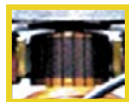
Collecteur céramique : pour une plus grande durée de vie