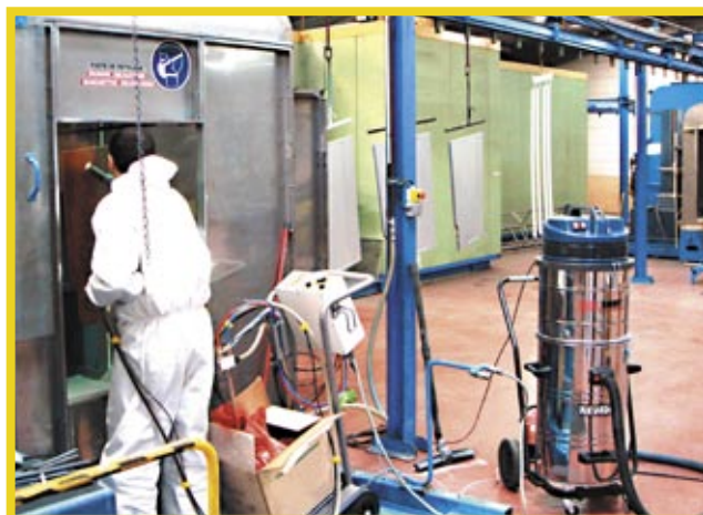
Aspiration pour nettoyage de l'environnement et de la cabine de poudrage